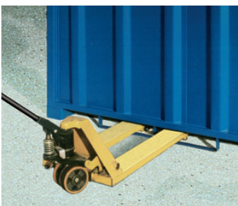
Staplertaschen auch für Hubwagen geeignet