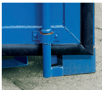
Tür mit Dichtgummi und Verriegelungsstange